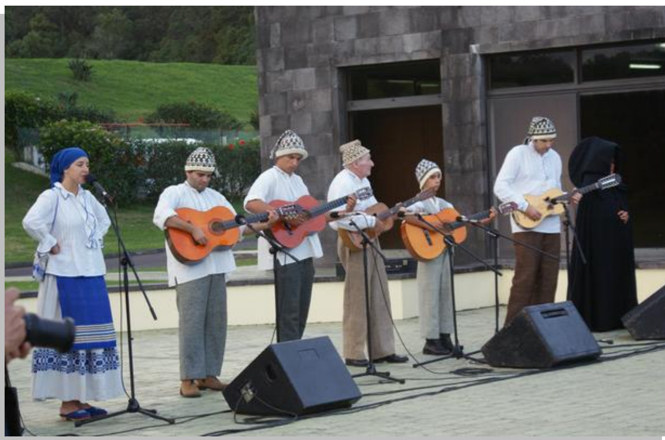
Underhållningen vid Batalha Golf Course (Welcome Reception)

Efter incheckningen på hotellet deltog vi i resebyrå Hispanias informationstillfälle, där vi fick information om ön San Miguel och residensstaden Ponta Delgada. Därifrån skyndade vi oss till mötesplatsen vid Pontas da Mar invid hamnen för transport till kvällens välkomstmottagning. Deltagarna ombads vara på plats kl. 18.30 och den finländska delegationen infann sig först av alla. Vi var inbjudna av The Regional Secretary of the Presidency, Government of the Azores och bjöds på underhållning med musik och dans av en folklореgrupp från San Miguel. Efter underhållningen bjöds vi på plockmat och mingel till kl. 22.