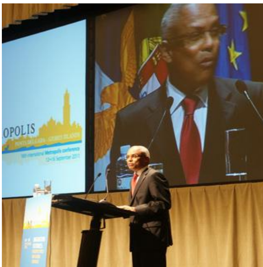
Avslutningstalet hölls av Kap Verdes premiärminister José Maria Neves.